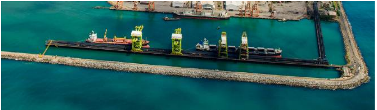
Figura 6 – Terminal de Praia Mole.

Os detalhes do píer estão no desenho 3000TU-G-40230.