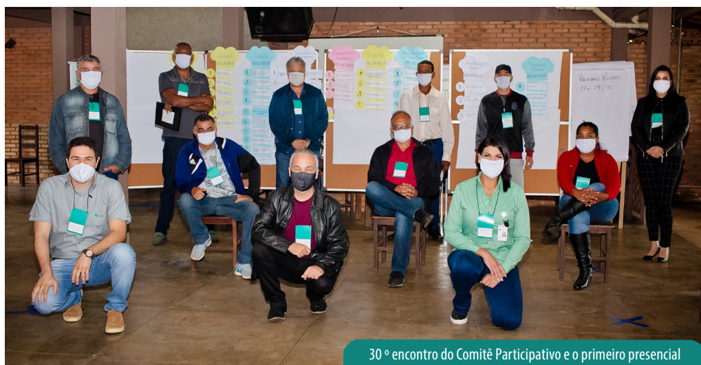
30º encontro do Comitê Participativo e o primeiro presencial