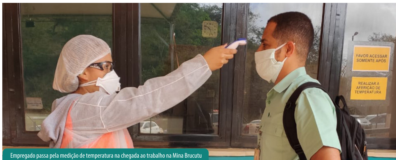
Empregado passa pela medição de temperatura na chegada ao trabalho na Mina Brucutu